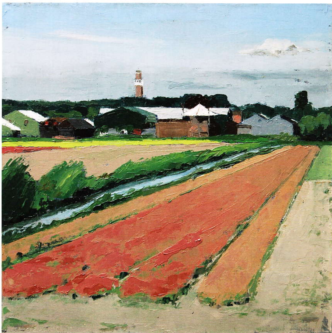
'Na de bloei' (2008), olieverf, 40 x 50 cm.

Al sinds haar opleiding op de Amsterdamse Wackers Academie werkt Zikken voornamelijk met het paletmes. Nadat ze met dat mes de verf op het doek heeft aangebracht, zet ze er soms een kleurnuance overheen, waardoor een vlak interessanter wordt. Je ziet daardoor dat de verf in meerdere lagen op het doek ligt, zodat bijvoorbeeld een bomenrij meer reliëf krijgt. Hoewel ze altijd al enkel nat in nat schildert, durft ze de laatste tijd meer 'in het vlak te doen'. Zikken gebruikt bijvoorbeeld