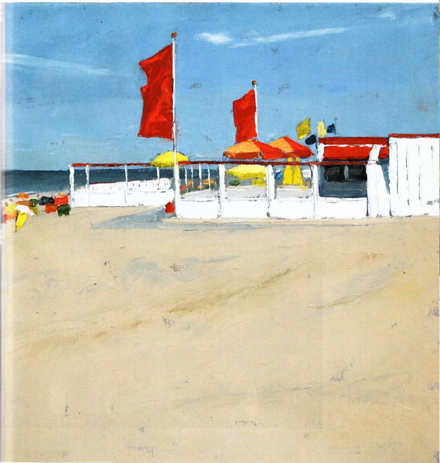
'Strandpaviljoen' (2008), olieverf, 40 x 40 cm.

Ook de schaduwen krijgen meer dan gewone aandacht in het werk van Zikken. Op een blauwe container valt een donkerder schaduw dan op een witte. Doordat deze containers een bonte schakering vormen, krijgt de compositie iets levendigs, terwijl ze eigenlijk slechts is opgebouwd uit een serie kubusjes, met een voor- en zijaanzicht. Volgens Zikken zorgt de schaduwwerking ervoor dat haar werk niet slechts als een compositie van vlakken kan worden opgevat. 'Licht- en schaduw-