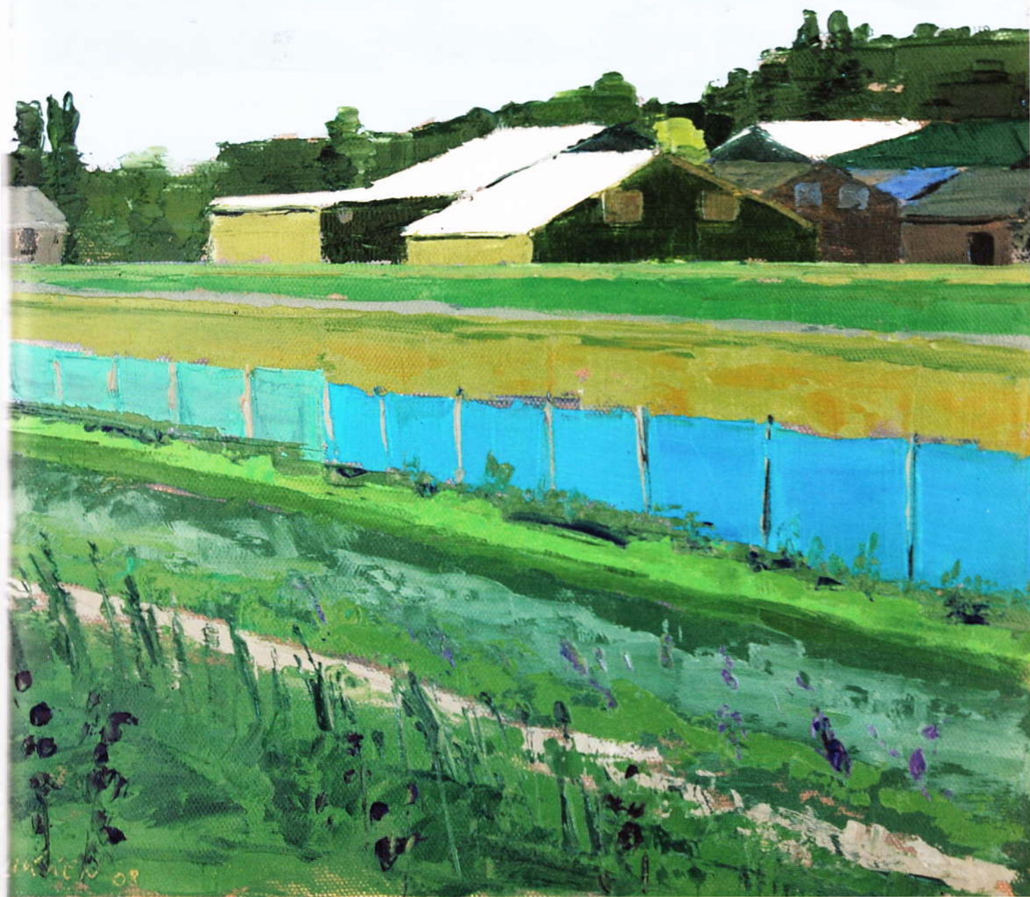
'Bollenschuren' (2008), olieverf, 30 x 30 cm.

ook een penseel waarmee ze de verf vrij droog aanbrengt, zodat de onderkleur er doorheen schemert. Bij zo'n vlak komt er geen paletmes aan te pas, vertelt ze. Vroeger gebruikte Zikken een rode of blauwe ondergrond. Door haar gebruik van het paletmes bleef je die onderkleur op kleine plekjes zien. Ze zette bijvoorbeeld haar doeken op met een onderkleur in rood, dat alleen nog zichtbaar bleef op de kleine plekjes waar het mes een te dunne verlaag achterliet. 'Ik vond dat dat het beeld interessanter maakte, maar ik doe het nu niet meer omdat het een soort truc werd.'