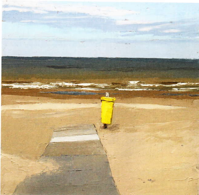
'Prullenbak' (2008), olieverf, 40 x 40 cm.

Het perspectief dat Zikken voor haar schilderijen kiest, zorgt ervoor dat het doek aandacht vraagt voor de compositie, en niet voor het beeld zelf. Zo plaatst ze in het midden van een fabrieksschilderij een lange pijp, die het beeld letterlijk in tweeën deelt. Een ander schilderij, waarop twee bootmasten een perfecte balans vormen, kon in eerste instantie niet worden afgemaakt toen bleek dat een van de twee boten plotseling wegvoer. Zikken: 'Ik zie vaak iets en denk vervolgens meteen: dat wil ik. Dat kan zijn: een doorkijkje tussen een stukje van een kerk rechts en een gebouw links. Of de schaduw van een boom, die een kleur heeft die terugkeert in de muur van een schuur. Je kijkt naar een beeld, en probeert je te concentreren op de vlakverdeling en niet op de details.' Zikken zorgt op deze manier niet alleen voor een bepaalde balans in haar werk, maar ook stuurt ze zo de aandacht van de kijker. 'Een prominent wit vlak in mijn werk moet aantrekken, en dat gebeurt vooral als het vergezeld wordt door andere vlakken met net een andere kleur of structuur', vertelt ze. Zo bezien is haar werk welhaast abstract te noemen, maar dat is een misvatting, aldus de kunstenaar. 'Alles kun je terugvinden in de werkelijkheid. Het is alleen een bepaalde manier van kijken die je je eigen moet maken. Vaak maak ik eerst